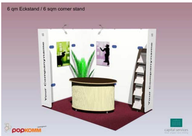
Eckstand / corner stand – 6 m 2