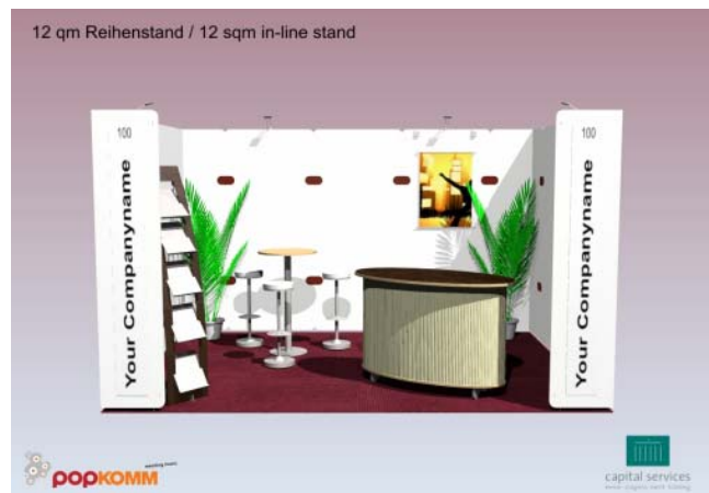
Reihenstand / in-line-stand – 12 m 2