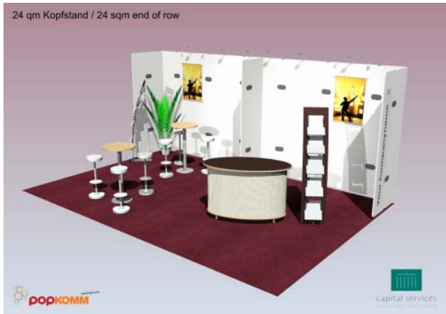
Reihenstand / in-line-stand – 6 m 2