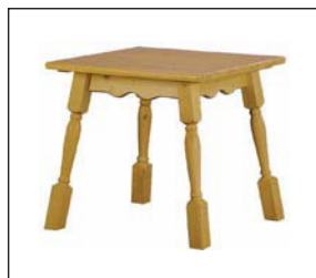
Bauertisch Kiefer natur Farmhouse table pine wood 70 × 70 × 72 cm