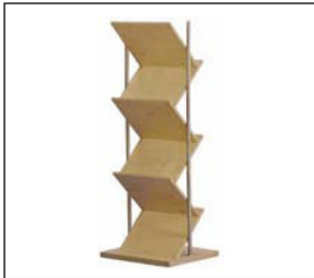
Prospektständer „Zickzack“ Birke natur Brochure stand “Zigzag” birch wood 40 × 50 × 160 cm