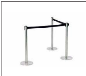
Absperrständer d: 30 cm , h: 100 cm Cordon post d: 30 cm , h: 100 cm