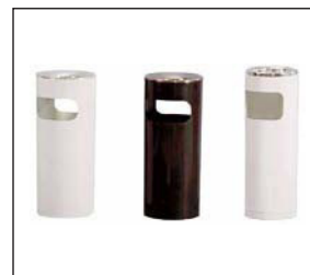
Standascher lichtgrau Upright ashtray light grey d: 25, h: 60 cm