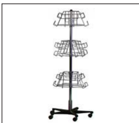
Prospektständer 12 DIN-A4-Fächer Brochure stand 12 compartments DIN A4 40 × 40 × 170 cm