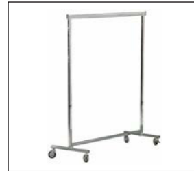
Konfektionsständer groß, chrom Coat rack big, chrome 130–190 × 160 cm