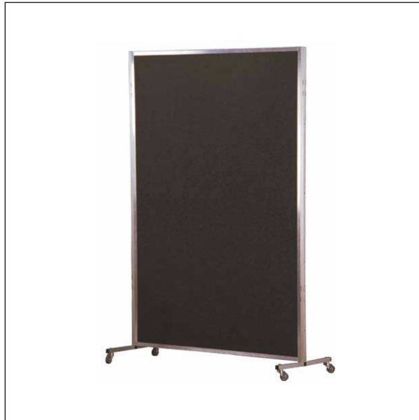
Trennwand, rollbar anthrazit/stoffbespannt 150 × 200 cm Partition, moveable anthr/fabric covered 150 × 200 cm