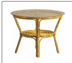
Rattantisch, rund natur/Glas Rattan cane table, round natural/glass 75 × 56 cm