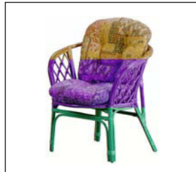
Rattansessel natur mit Poster Rattan cane armchair natural, with pad 75 × 72 × 40/77 cm