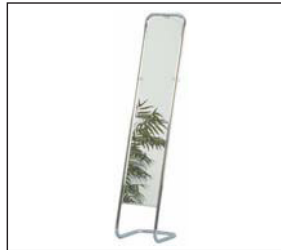
Standspiegel chrom Stand mirror chrome 45 × 45 × 180 cm