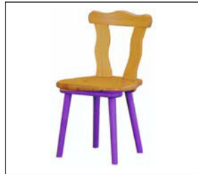
Bauernstuhl Kiefer natur Farmhouse chair pine wood 42 × 47 × 43/82 cm