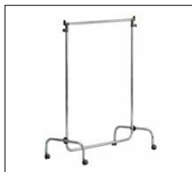
Konfektionsständer klein, chrom Coat rack small, chrome 100 × 150–190 cm