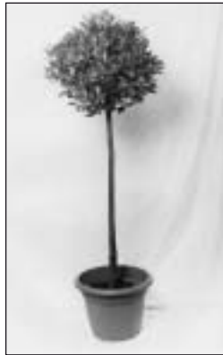
560071/560072 Lorbeerkugel Lauren globe 160 cm/180 cm