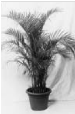
Auf Anfrage/on request Areca-Palme Areca palm