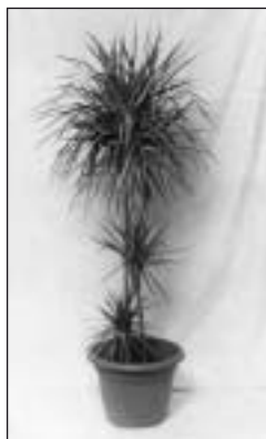
Auf Anfrage/on request Dracaena Dracaena