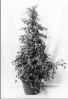
560401/560402/56408/560403 Ficus Benjamini, grün/weiß Ficus Benjaminie, green/white 150 cm, 180 cm, 200 cm, 250 cm