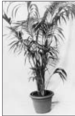
560404/560405/560407/560406 Kentia-Palme Kentia palm 150 cm, 180 cm, 200 cm, 250 cm