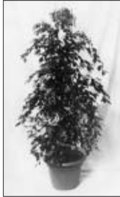
560401/560402/56408/560403 Ficus Benjamini, grün Ficus Benjaminie, green 150 cm, 180 cm, 200 cm, 250 cm