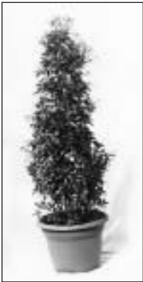
560070 Lorbeerpyramide Lauren pyramid ca./approx. 180 cm