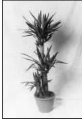
Auf Anfrage/on request Yucca-Palme Yucca palm ca./approx. 160 cm