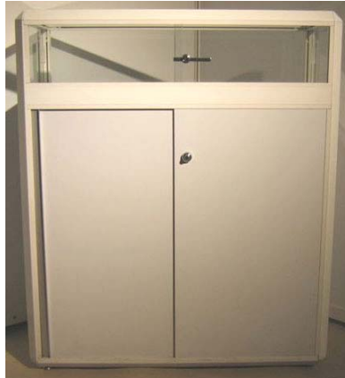
2110 Schauvitrine/Show case "B" 860 x 400 mm, h: 900 mm