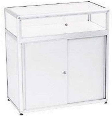
50110 Tischvitrine/Show case 1000x539x1960 mm