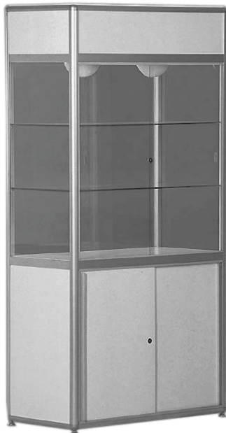
50121 Standvitrine/Upright display case beleuchtet/illuminated 1000x520x2060 mm