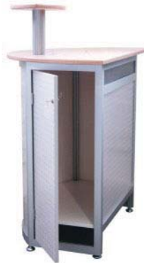
50631 Computer-Stehpult/High desk with display console, 1000/700x500x1260 mm