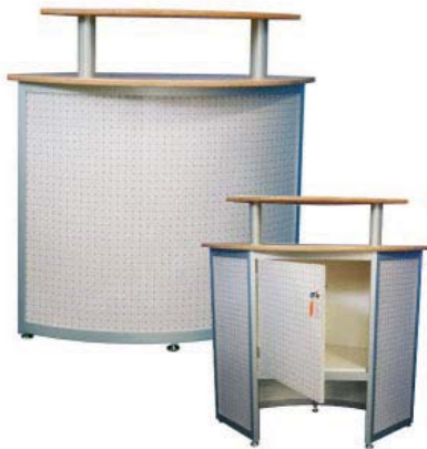
50630 Counter Alu, Buche/aluminium, beech 1090x540x1050 mm