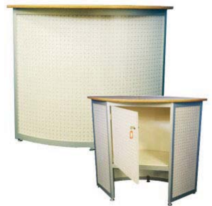
50635 Counter Alu, Buche/aluminium, beech 1090x540x1050 mm