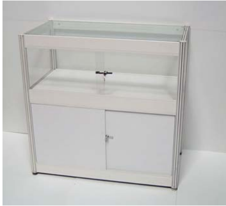
2110 Schauvitrine/Show case "A" 1030 x 535 mm, h: 1000mm