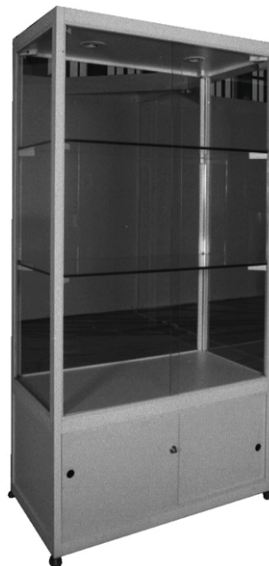
2100 Standvitrine/Upright display case beleuchtet/illuminated 1000x500x2100 mm