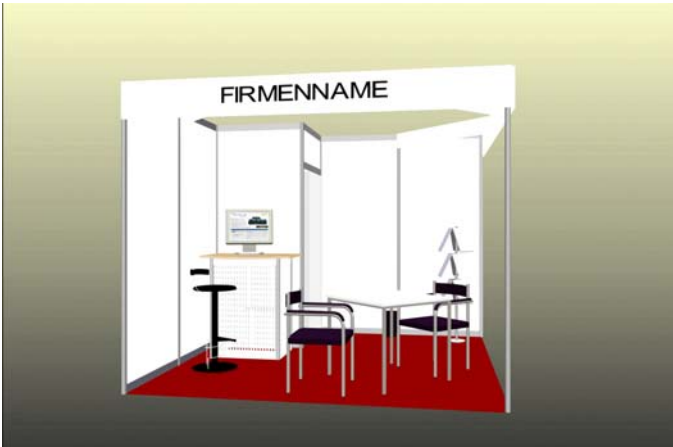
9 m 2 Komplettstand Preis Reihenstand: EUR 2.650,- (zuzügl. MWSt.)