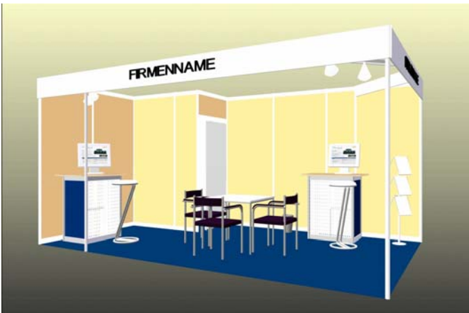
15 m 2 Komplettstand Preis Reihenstand: EUR 4.350,- (zuzügl. MWSt.)